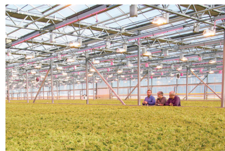
АО «Совхоз» «Тепличный», Южно-Сахалинск

Светильники-облучатели RX-7-H-600W-S / PILA светотехнического предприятия «СВЕТОГОР» эксплуатируются на нашем предприятии с 2019 года. В настоящее время поставленное оборудование нас полностью устраивает, претензий к поставленным светильникам и лампам нет. Деградация светового потока незначительна.