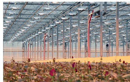
АО «РоузХилл», Калужская область

Тепличные светильники СВЕТОГОР RX-7-H-1000W-S, поставленные нашему хозяйству в сентябре 2018 года эксплуатируются в составе осветительной установки в количестве 1 048 шт. Зажигание ламп надежно, облученность для светокультуры розы, заявленная производителем, обеспечивается. Выход из строя светильников и ламп за три года не превысил 0,1%. Претензий к качеству светильников по состоянию на сегодняшний день не имеем. Рекомендуем данный светильник к использованию в промышленных тепличных комбинатах.