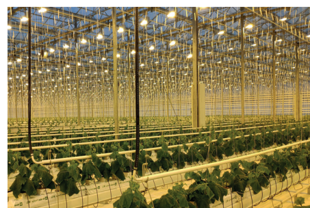
ООО «ЭкоПродукт» (ТК «Успенский»)

ООО «ЭкоПродукт» выражает искреннюю благодарность за сотрудничество ООО ПТК «СВЕТОГОР». Светильники СВЕТОГОР RX-7-H-1000W-S в количестве 8 554 шт. были поставлены своевременно по договору в 2018 г. С момента ввода в эксплуатацию рекламационные случаи по светильникам и лампам минимальны и не превысили 0,5%. Всё поставленное оборудование отвечает заявленным техническим характеристикам и обеспечивает высокие показатели облученности для получения хороших урожаев.