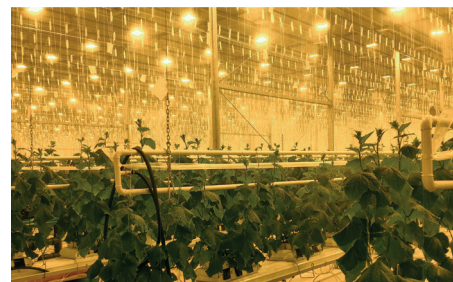
ООО УК «Горкунов», ТК «Обской»

С 2019 года на всех своих новых проектах мы начали применять светильники СВЕТОГОР RX-7-H-1000W-S и СВЕТОГОР RX-7-H-600W-S, которые позволяют значительно увеличить эффективность, в том числе, ресурс и надёжность работы светотехнического оборудования. Это позволило также увеличить облученность светокультуры на всех годах эксплуатации за счет значительного уменьшения снижения светового потока по сравнению со всеми имеющимися аналогами. В 2020 году на одном из собственных комбинатов мы внедрили гибридное освещение с использованием LED-светильников, значительно уменьшив потребляемые электрические мощности, увеличив при этом облученность светокультуры овощей.