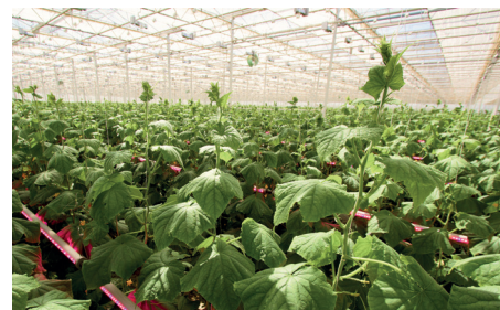
ООО «Луховицкие Овощи», ООО «УК «Рост»

Компания «СВЕТОГОР» является нашим постоянным поставщиком. За последние три года, начиная с 2018 года, была осуществлена поставка более 150 000 светильников облучателей СВЕТОГОР RX-7-H-1000W-S на комбинаты «Луховицкие овощи», «Журиничи», «ТюменьАгро», «Нижегородский», «Мичуринский». Кроме того, для организации гибридной досветки в ТК «Луховицкие овощи», была осуществлена поставка межрядных LED модулей на площади более 10 Га. Все обязательства по поставкам были выполнены компанией «СВЕТОГОР» полностью и в срок. СВЕТОГОР является надёжным партнером и ответственным исполнителем в реализации сложных технических проектов.