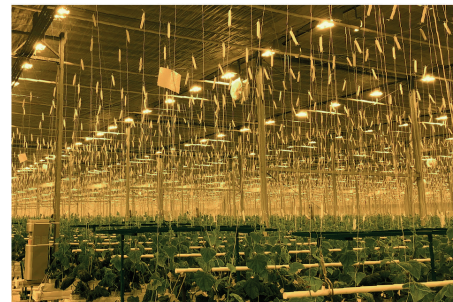
ООО «ТК «Зеленая линия», р-н Тихорецкий

Мы сотрудничаем с компанией «СВЕТОГОР» с 2019 года. За это время для нашего ТК «Зелёная линия» было поставлено 8 338 светильников СВЕТОГОР RX-7-H-1000W-S, 22 350 ламп Philips GreenPower XTRA 1000W и 6 300 ламп Philips GreenPower Plus 600W. Выбор этих светильников и ламп был осуществлен из-за надежного качества электронных балластов и ламп, гарантирующих надежную работу светильников и ламп, что в свою очередь позволит увеличить нашу рентабельность за счет увеличения облученности светокультуры и надёжной работы светильников в течение длительного срока эксплуатации.