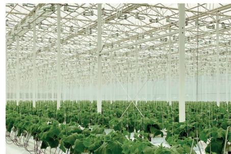
ООО ТК «Пермский»

Если говорить о сравнительной эффективности облучения различными светильниками, производимыми разными производителями, то необходимо говорить в первую очередь о надежности работы светильников на максимально длинном сроке эксплуатации и обеспечения заявленной облученности. Более 50 000 светильников СВЕТОГОР RX-7-H-1000W-S поставленных в тепличные комбинаты «Пермский», «Агрокультура Групп», «Елецкие овощи» весьма эффективны и помогают получать высокие урожаи. Использование гибридной досветки с межрядными LED-светильниками в ТК «Агрокультура Групп» на площади 1 га. Прирост урожайности после добавления междурядовой досветки составил 23% и полностью совпал с предварительными прогнозами специалистов.