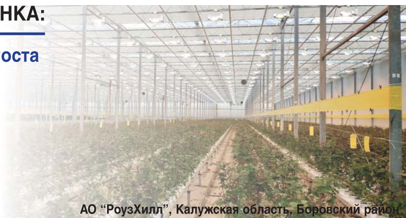
АО "РоузХилл", Калужская область, Боровский район

Мы успешно реализуем в России проекты на площади более 60 Га и общим количеством более 100.000 натриевых светильников а также являемся первой компаний в России реализующей несколько коммерческих гибридных проектов со светодиодной междурядовой досветкой Philips на площади более 10 Га и общим количеством более 20 000 светодиодных модулей.